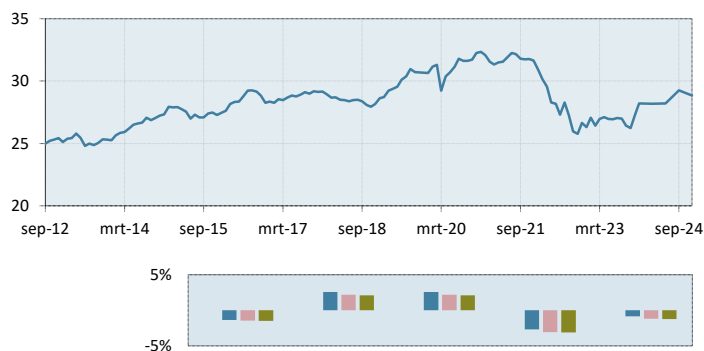
Rendementen Dit Kwartaal Dit Jaar 1 Jaar 3 Jaar 5 Jaar